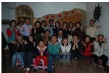
Petite photo en famille

Je suis désolé de pas trop développer sur le sujet mais en ce moment j'ai quelques problèmes avec internet! Par contre si vous avez des questions ou quoique se soit, n'hésitez pas à me demander!