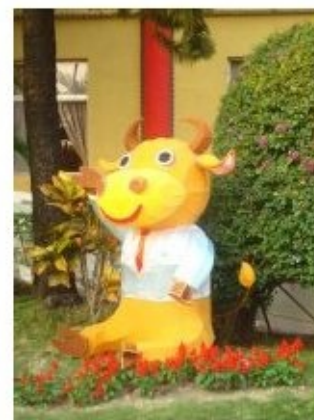
la vache à l'honneur cette année