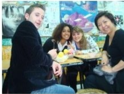
La veille de Noël dans un restaurant entrain de manger une glace taiwanaise...

Voilà quelques nouvelles de ma vie à Taiwan.