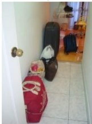
mes valises qui ont doublé voir triplé!!!!